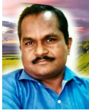
डॉ. बाळासाहेब लिहिणार