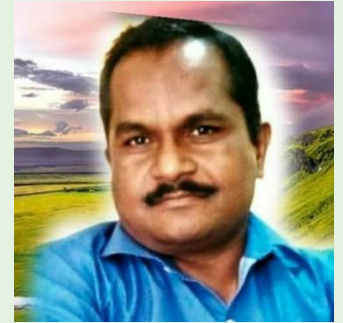
- डॉ. बाळासाहेब लिहिणार

नमन त्या गाडगेबाबांना वंदन त्या गाडगेबाबांना ज्याने देव दगडात नाही माणसात आहे म्हटले त्या गाडगेबाबांना