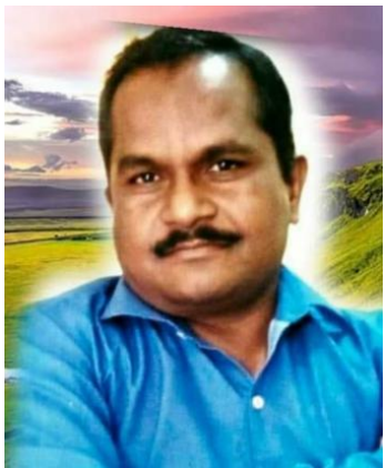
डॉ. बाळासाहेब लिहिणार

आज मिडिया प्रामाणिक नाही, कारण सत्याला किंमत नाही. इथे विकले जातात आवाज, विचार, माणसं... नोटांची भूक कधी संपत नाही.