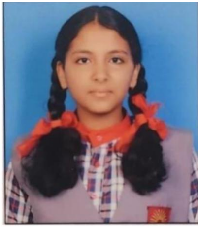
प्रतिक्षा आहरे ९४.१७%